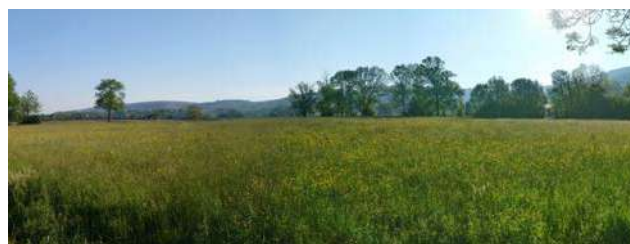
Photographie du lieu d'implantation du projet