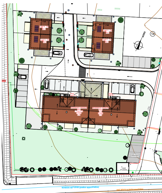
Plan MASSE du projet