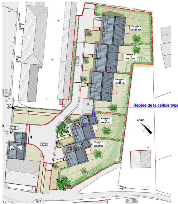
Plan MASSE du projet