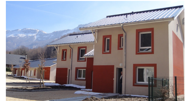
Photographies de la réalisation